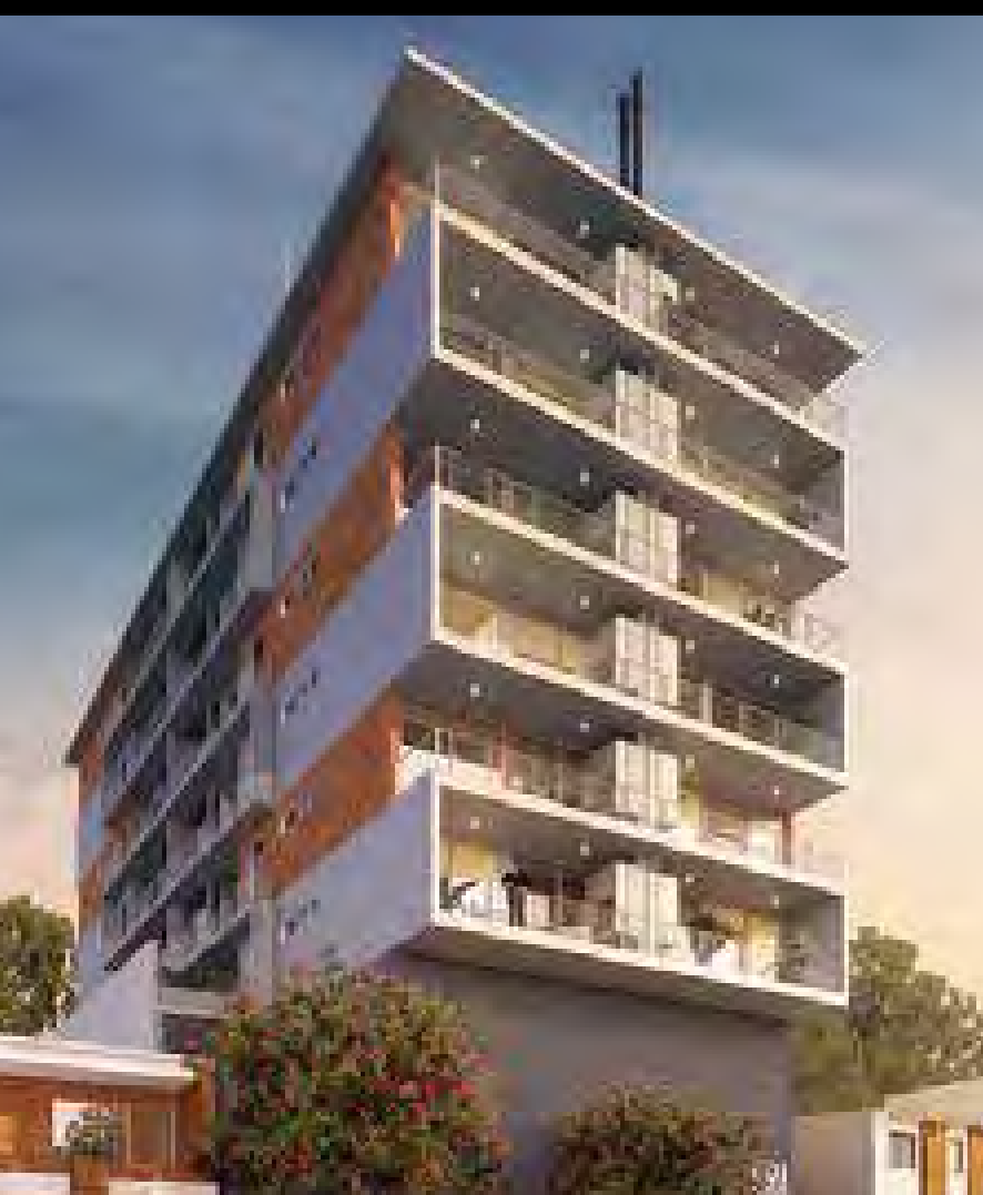
ALTOS DE SIRIA